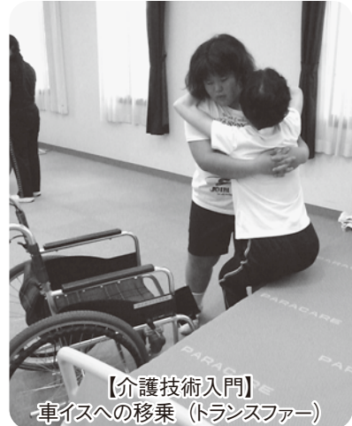
【介護技術入門】 車イスへの移乗(トランスファー)