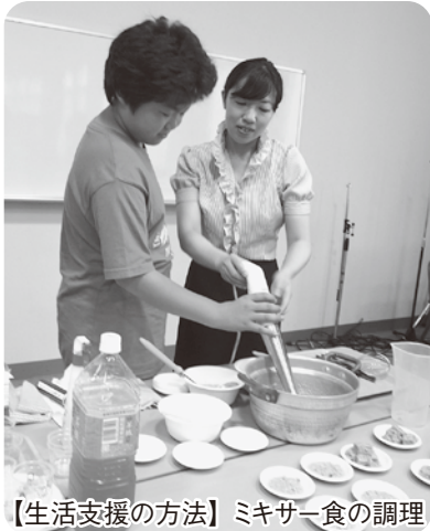
【生活支援の方法】ミキサー食の調理

6月19日(日)より全10日間の日程で、平成23年度地域介護ヘルパー養成研修を実施しました。今年には中学生6名を含む14名の方が受講し、茨城県地域介護ヘルパー養成研修を修了しました。また、赤十字救急法短期講習受講証と認知症サポーター認定を取得しました。