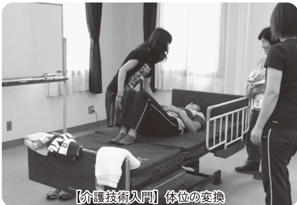
【介護技術入門】体位の変換