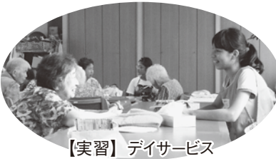
【実習】デイサービス