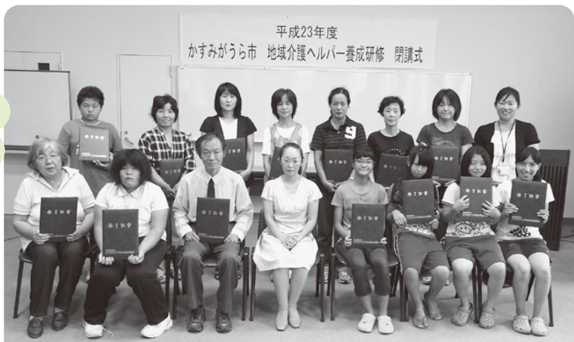
平成23年度 かすみがうら市 地域介護ヘルパー養成研修 閉講式 2011.08.28