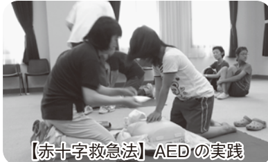
【赤十字救急法】AEDの実践