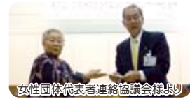
女性団体代表者連絡協議会様より