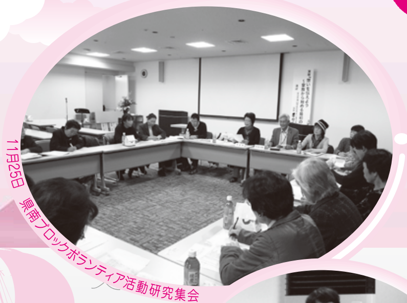
11月25日 県南ブロックボランティア活動研究集会