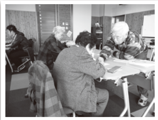
学習をサポートするボランティアさん

この教室では、学習者をサポートする20名のボランティアさんに協力していただきました。ボランティアの皆さんは、学習者の皆さんから元気をもらい、毎回の教室が楽しいと話していました。