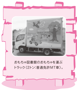
おもちゃ図書館のおもちゃを運ぶトラック(2トン:普通免許MT車)。

作品例 ・あかずきんちゃん ・一休さん ・ぶんぶく茶釜 ・かぐや姫 ・金太郎 などなど