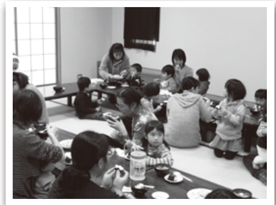
「すいとん、いただきまーす!!」