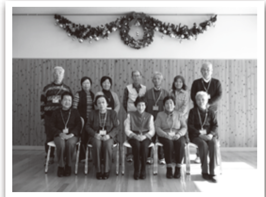
閉講式での記念撮影（やまゆりコース）