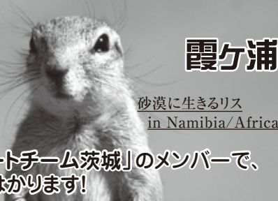
砂漠に生きるリス in Namibia/Africa

当事務所は「障害年金請求サポートチーム茨城」のメンバーで、 困難な案件はチーム力で解決をはかります!