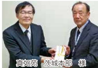
真如苑 茨城本部 様