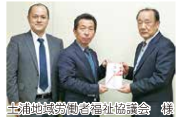
土浦地域労働者福祉協議会 様