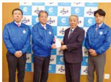
土浦北ライオンズクラブ 様