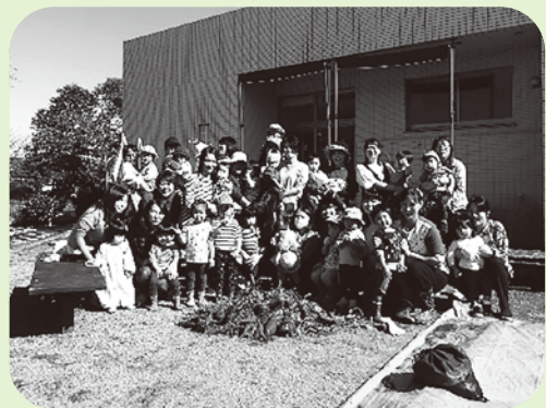
たくさんのお芋がとれました♪