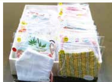
特別養護老人ホームセンチュリー石岡様より、手作りマスクをご寄贈いただきました。