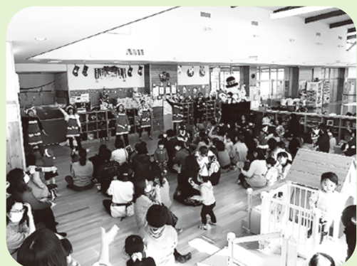
盛り上がったクリスマス会!