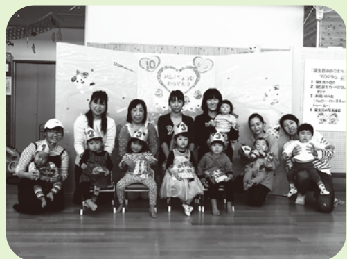
誕生日をみんなでお祝い!