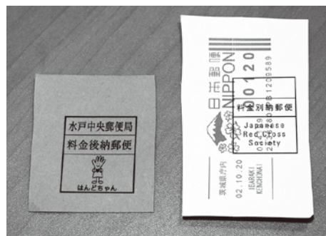
メータースタンプや郵便料金計器で印字されたもの等