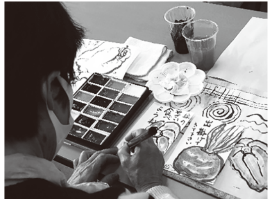
絵手紙を描く様子