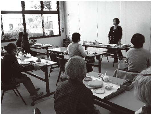
描き方について講義を受ける様子