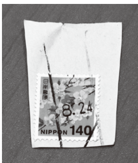
消印が切り取られたもの