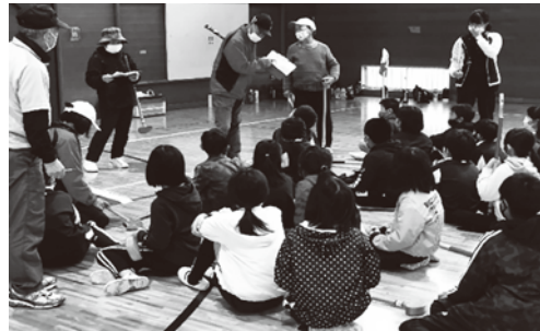
10/22 グラウンド・ゴルフ体験