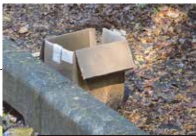
柏崎（石岡田伏土浦線）