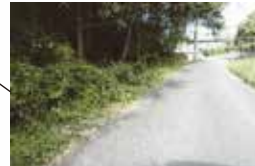
田伏（農村集落センター付近）