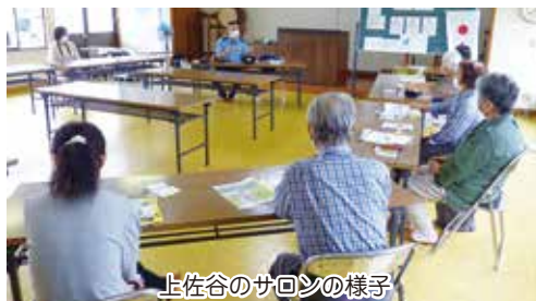
上佐谷のサロンの様子