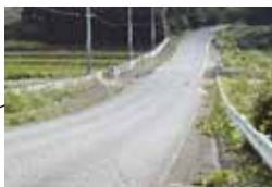
志土庫駐在所から旧志土庫小学校方面へ