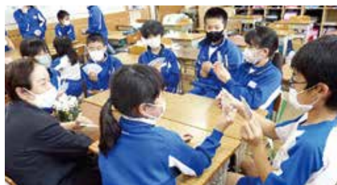
地域の皆さんと楽しい一時♪