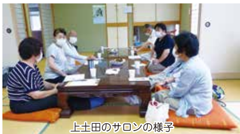
上土田のサロンの様子