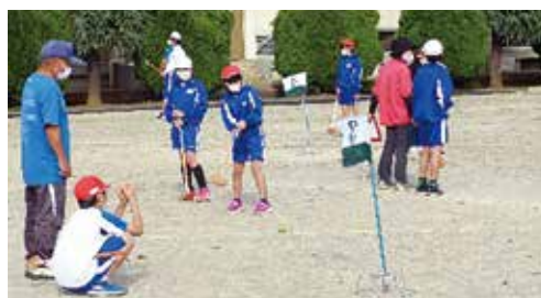
ホールポストをめがけて！