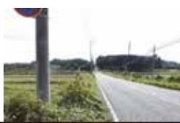
馬場山交差点を荻平本郷方面へ