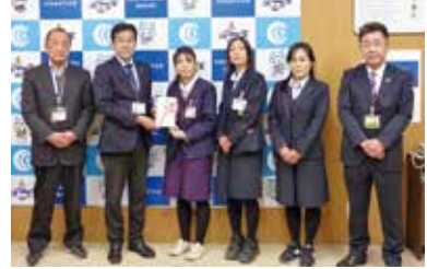
水戸ヤクルト販売株式会社 様